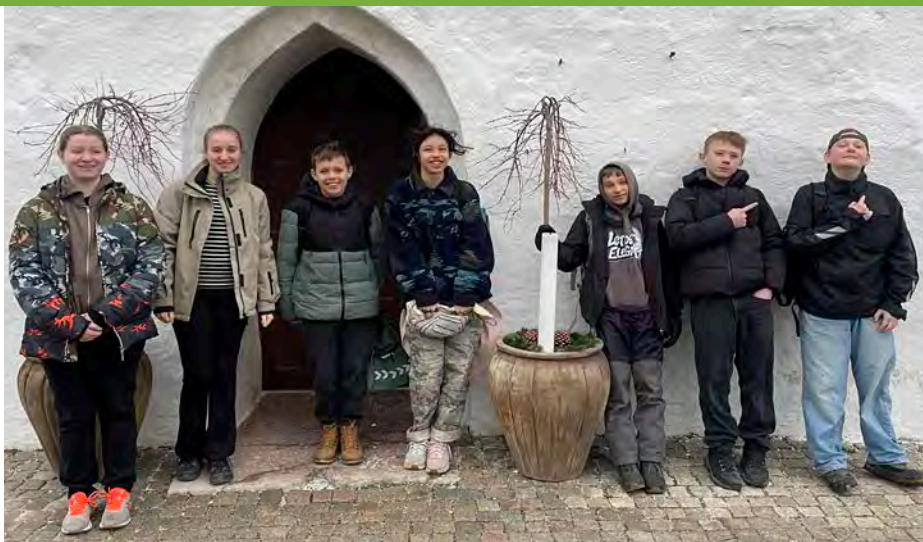
Vi ønsker konfirmanderne og deres familier en smuk dag.